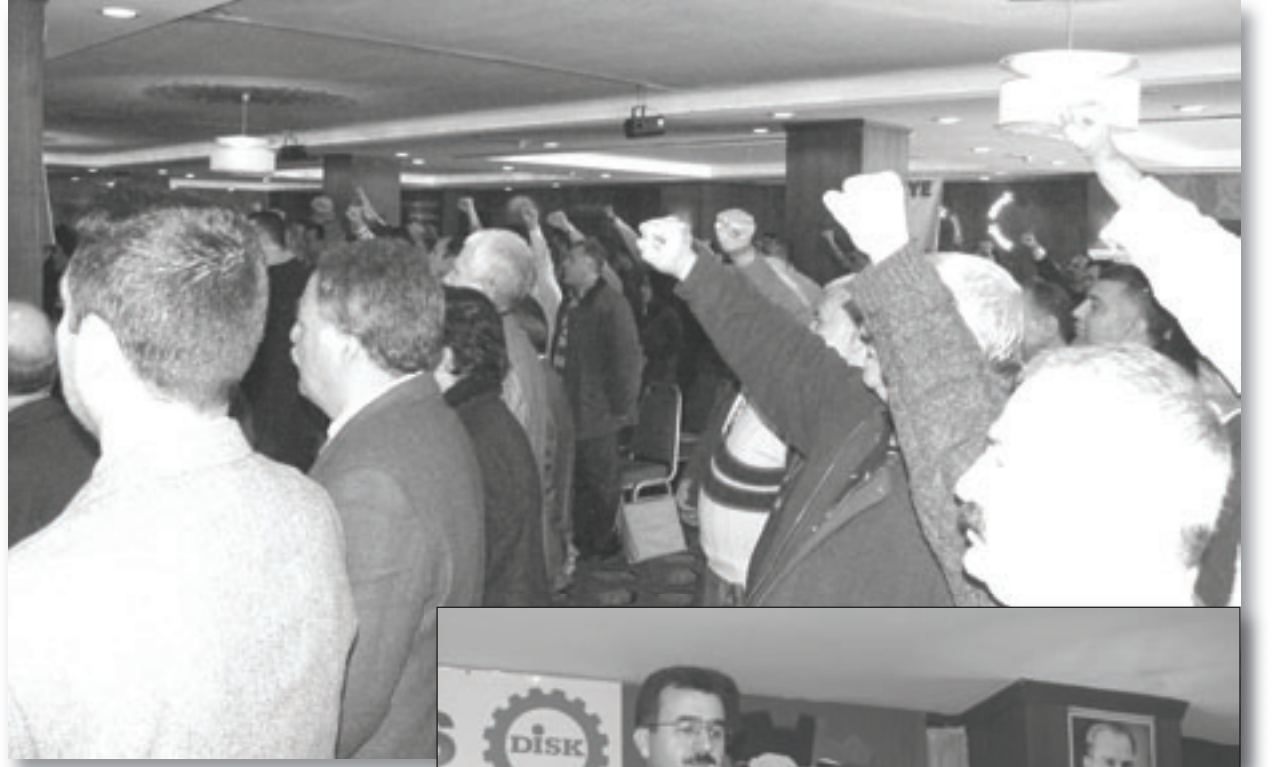
koltuk değneklerine karşı alınan tutum oluşturuyor.

Bu durumun bir diğer yanını ise ihanetçi şubenin